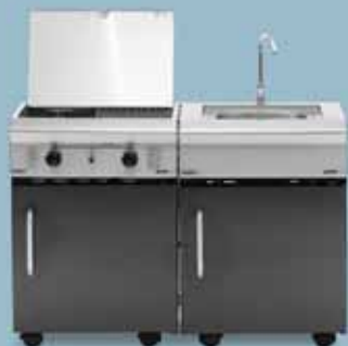
freedom 450 + freedom 440