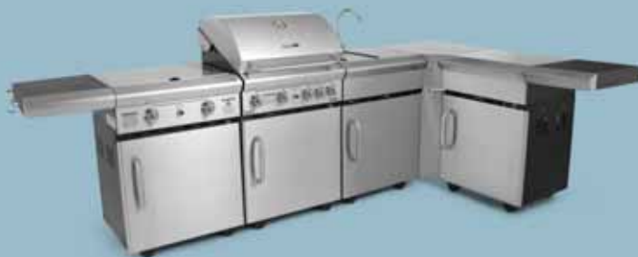
freedom 455 + freedom 321x + freedom 445 + freedom 435 hjørne + freedom 425 opbevaring