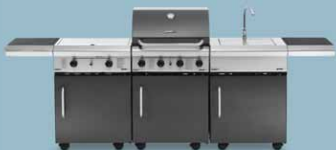
freedom 450 + freedom 321c + freedom 440