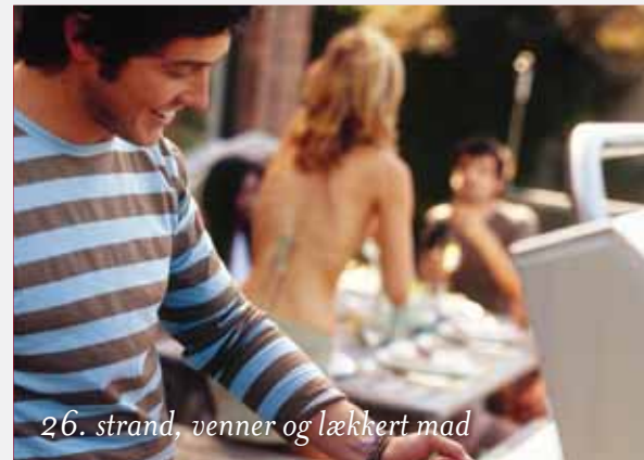
26. strand, venner og lækkert mad