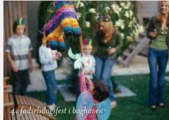
4. fødselsdagsfest i baghaven