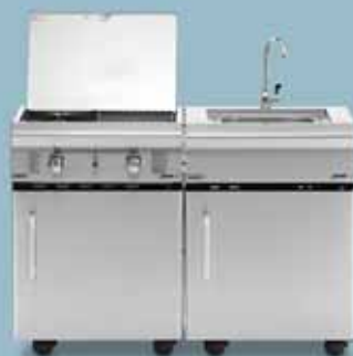
freedom 455 + freedom 445