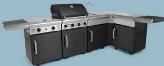
freedom 450 + freedom 321c + freedom 440 + freedom 430 hjørne + freedom 420 opbevaring