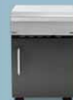
freedom 420 opbevaring