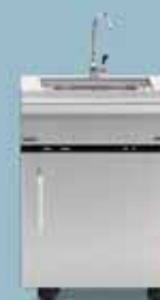
freedom 445 vask