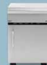
freedom 425 storage