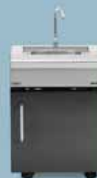
freedom 440 vask