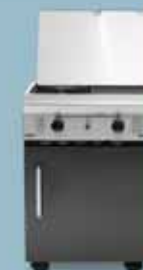
freedom 450 gasplade