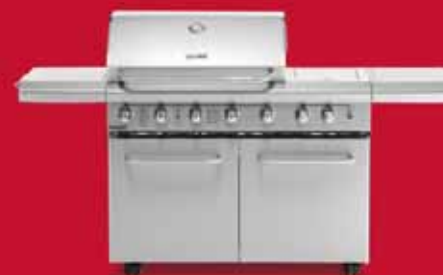
professional 584 kan omstilles til naturgas