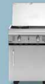
freedom 455 gasplade