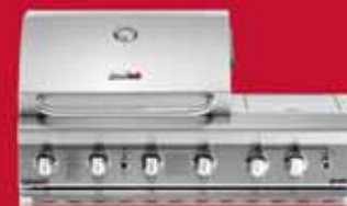
professional 482, integreret