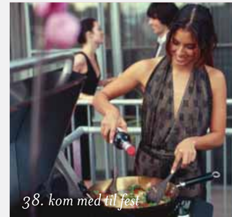
38. kom med til fest