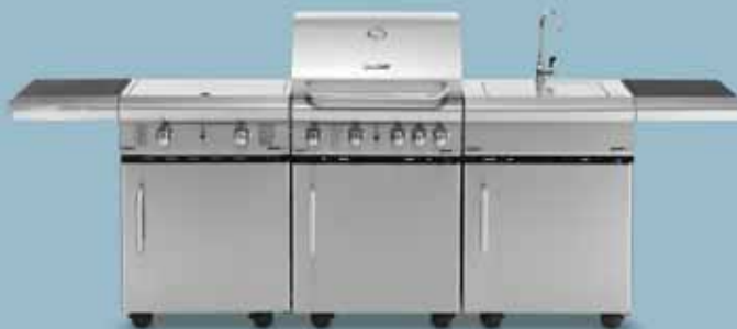
freedom 455 + freedom 321x + freedom 445